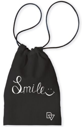
Modelo Biovest Smile

Las bolsas porta mascarillas BioVest están confeccionadas para un correcto guardado de su mascarilla, ofreciendo una alta eficacia frente a la penetración microbiana, aerosoles y partículas. Destaca por su durabilidad sin perder prestaciones (más de 60 lavados). Diseñada y confeccionada 100% con mucho mimo en España.