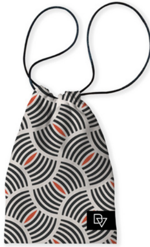
Modelo Biovest 70's