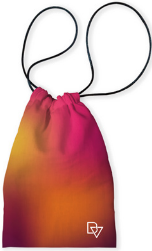
Modelo Biovest Fire