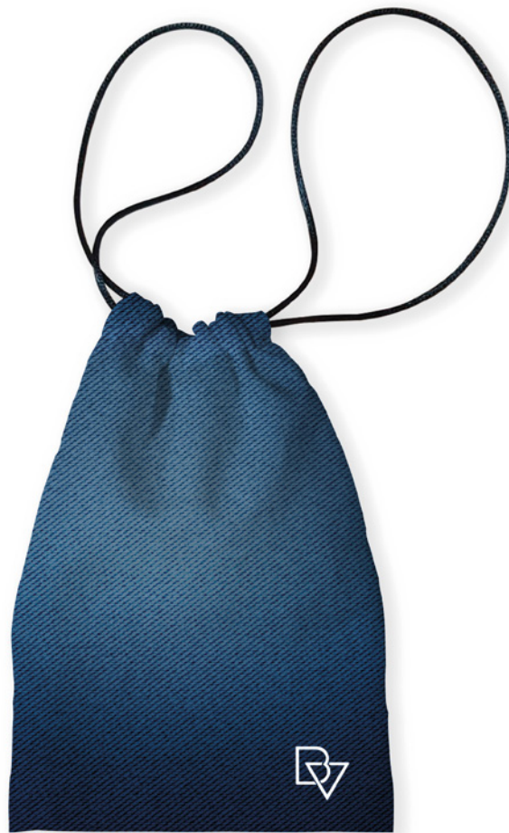
Bolsa guarda mascarillas Modelo Biovest Action

Tejido con tratamiento hidrofugado y biocida, ideal para guardar objetos (teléfonos, mandos a distancia, pendientes, relojes, etc.)